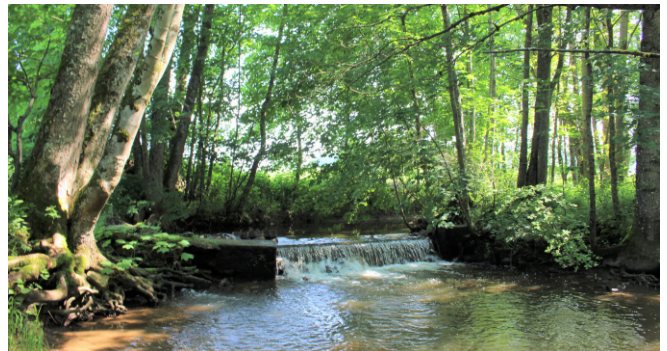
seuil prise d'eau de l'étang sur la rivière la Blette

D'autres opérations sont à l'étude, notamment celle confiée à un bureau d'étude par la communauté de commune de Vezouze en Piémont, dans le cadre de sa compétence GEMAPI (gestion des milieux aquatiques et prévention des inondations) sur le cours d'eau la Blette. L'objectif est d'effacer les seuils, d'améliorer la prise d'eau de l'Etang-Sous-Launoy, de consolider les berges au niveau des habitations et de limiter ainsi les conséquences des inondations.