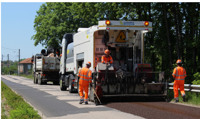
mise en œuvre d'un Enrobé Coulé à Froid (ECF) dans la traversée du village RD 992 les 1er et 2 juin

A noter la récente réfection du revêtement de la RD 992, dans la traversée du village, réalisée par le département de Meurthe et Moselle.