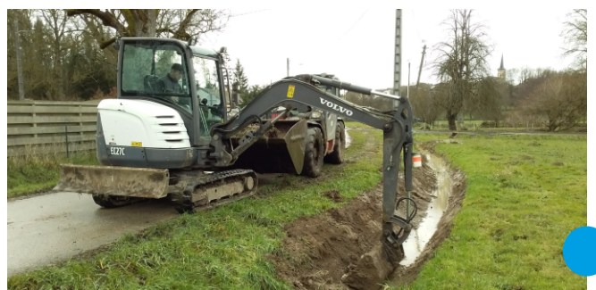
curage des fossés au Maix Colin

En parallèle, des travaux de curage des fossés, de fauchage des accotements, d'entretien des espaces verts, des chemins et des bâtiments sont réalisés par des entreprises, nos agriculteurs, notre agent et les bonnes volontés.