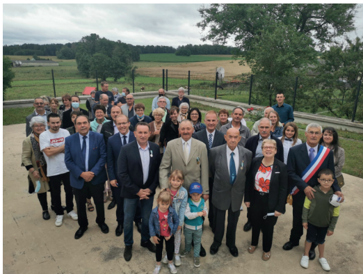
14 Juillet, remise de médailles.