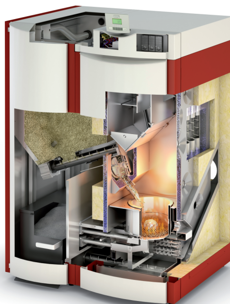
Schéma de principe de la chaudière à granulés bois Windhager mise en place au printemps 2022.

Les travaux préparatoires à l'aménagement de la chaufferie ont commencé dans l'ancien garage à proximité du bâtiment mairie. L'opération sera réalisée tout au long de l'année 2022.