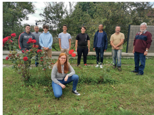
Réception convivial des jeunes ayant participé aux chantiers argent de poche.