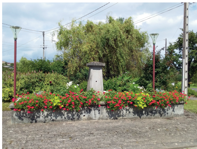
Fleurissement et valorisation des fontaines.