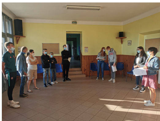
Cérémonie de remise des chèques cultures aux 6 diplômés 2021.